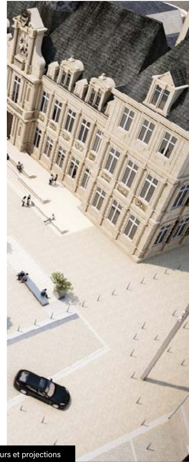
L'hôtel de ville de Reims | Extérieurs et projections