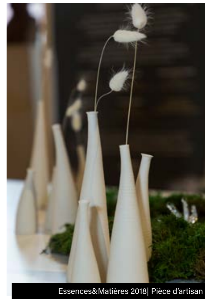
Essences&amp;Matières 2018 | Pièce d'artisan