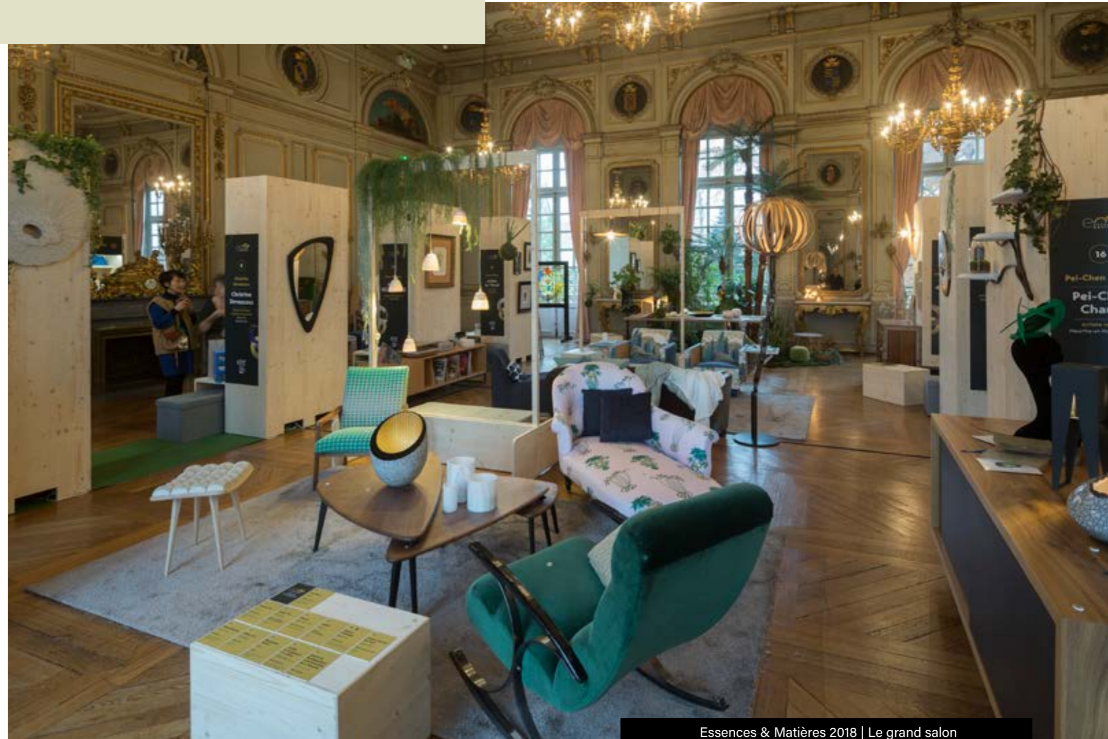
Essences & Matières 2018 | Le grand salon

Une immersion dans l'univers des métiers d'art