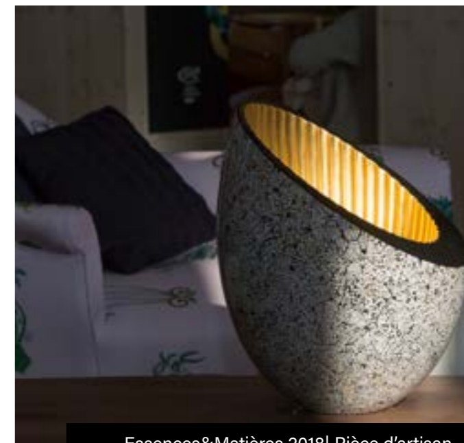
Essences&amp;Matières 2018 | Pièce d'artisan