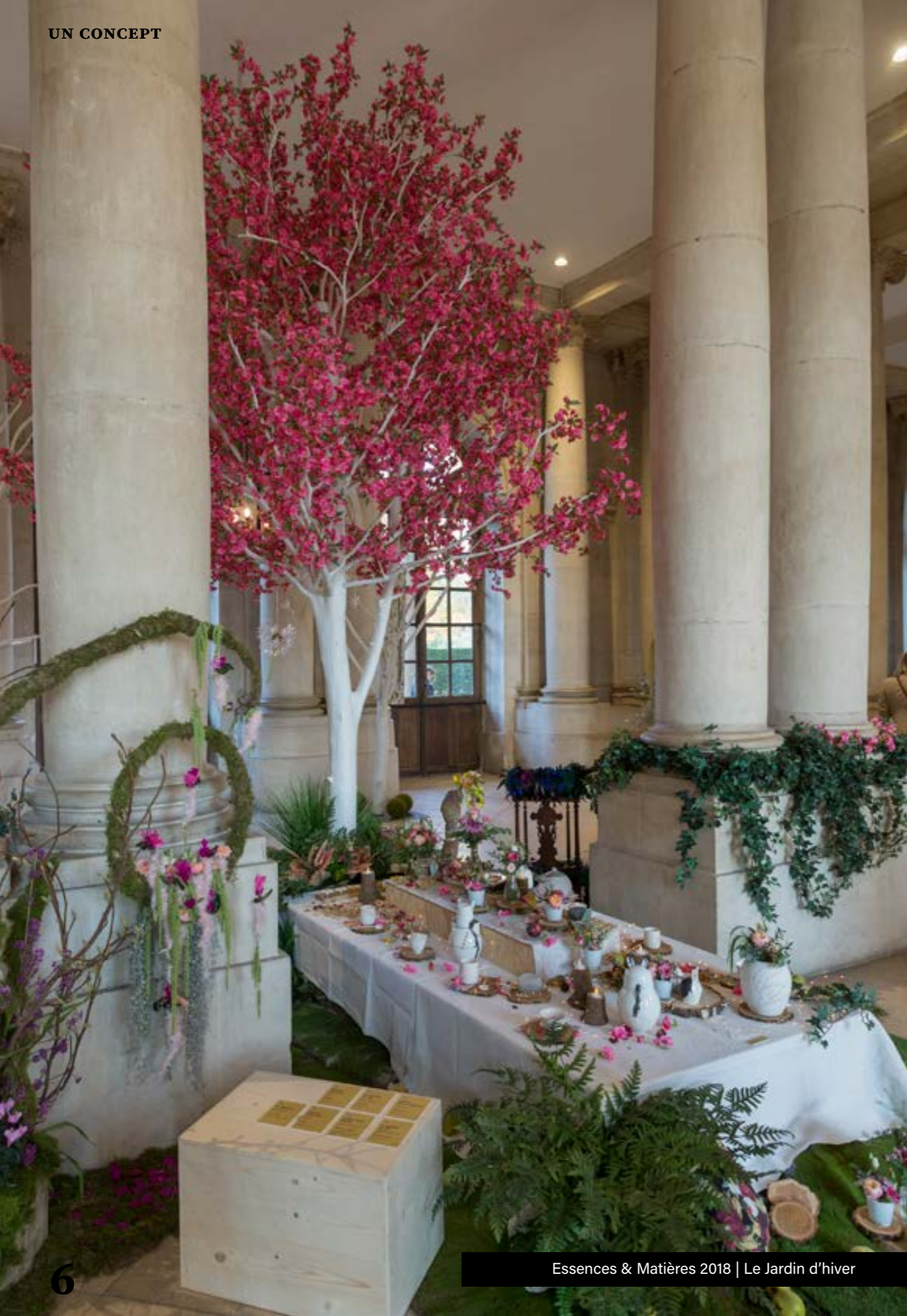
Essences &amp; Matières 2018 | Le Jardin d'hiver

Evènement d'envergure régionale destiné à valoriser l'artisanat d'art du Grand Est Essences & Matières propose un voyage dans un lieu d'exception à travers une scénographie soignée , développée et habillée par des pièces d'artisanat d'art du Grand Est.